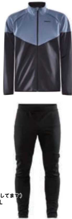
Warm Jacket JR/Warm 3/4Zip Pants JR 1904634/1906775 サイズ: 130のみ ¥20,460 (税込) ●裏地フリース付きジュニアウェア