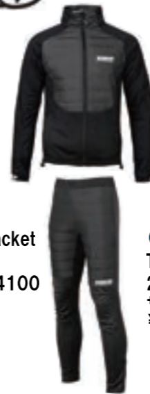
01 Hybrid Jacket Hybrid Pant 224001/224100 サイズ: M, L ¥45,100 (税込)