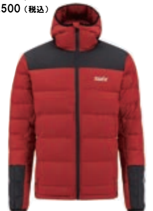
14 ダイナミックダウンジャケット サイズ: S, M ¥38,500 (税込)