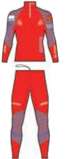
11 LAHTI TWO PIECES SUIT サイズ: S, M ¥24,200 (税込)