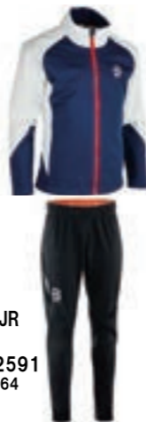
11 ELITE Jacket JR PRO Pants JR 333562/332591 サイズ: 152, 164 ¥27,500 (税込)