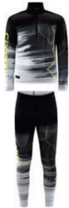
01 PRO Velocity Jersey/Tights 1909572/1909573 サイズ: Mのみ ¥23,760 (税込) ●マルチブラック ●リサイクルポリエステル92% ●エラストン8%