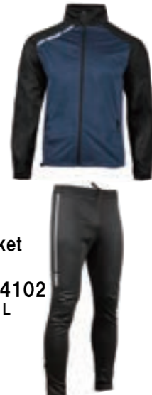
03 TRE Jacket TRE Pant 224007/214102 サイズ: S, M, L ¥27,500 (税込)