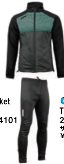
02 TWO Jacket TWO Pant 224006/214101 サイズ: M, L ¥34,100 (税込)