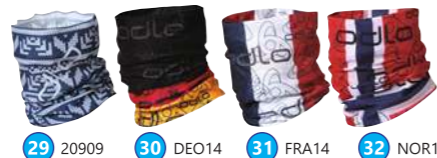
29 20909 30 DEO14 31 FRA14 32 NOR14 773400 TUDE ODLO LIGHT ¥3,570