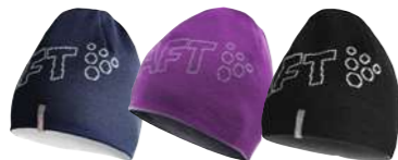
11 2395 ダークネイビー 12 2490 オークキッド 13 2999 ブラック 194677 CRAFT TEAM CAP ¥3,150 ●サイズ:SM/56,LXL/58