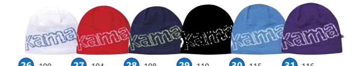
26 100 27 104 28 108 29 110 30 115 31 116 A85 ¥4,095