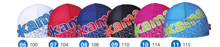
06 100 07 104 08 108 09 110 10 114 11 115 AW33 ¥4,515