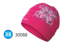
38 30088 791770 HAT MICROFLEECE SNOW ¥4,410