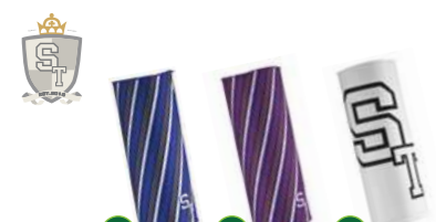
54 5046/ブルー 55 5047/パープル 56 5049/ホワイト ST ヘッドウェア ¥3,675