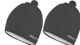
14 1390 ネイビー 15 1999 ブラック 199172 ADRENALINE ¥3,675 ●サイズ:SM/56,LXL/58