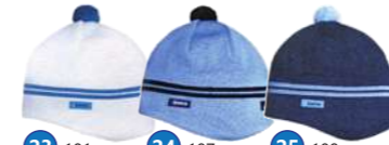
23 101 24 107 25 108 A26 RUNNING HAT ¥4,095