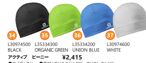
34 L30974500 BLACK 35 L35334300 ORGANIC GREEN 36 L35334200 UNION BLUE 37 L30974600 WHITE アクティブ ビーニー ¥2,415 ●サイズ:フリー ●素材:ポリエステル89%、ポリウレタン11%