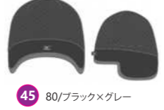
45 80/ブラック×グレー A50BM-450 ヘルメットインナー (薄ニットキャップ) ¥3,570