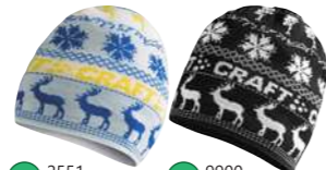
05 2551 ホワイトイエロー 06 9900 ブラックホワイト 1900370 INGE HAT ¥3,150 ●サイズ:SM/56,LXL/58