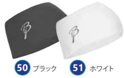
50 ブラック 51 ホワイト ヘッドバンドポリニット ¥3,675