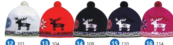
12 101 13 104 14 108 15 110 16 114 A28 RUNNING HAT ¥4,515