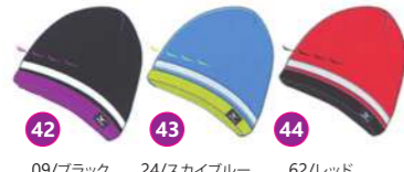
42 09/ブラック 43 24/スカイブルー 44 62/レッド A50BM-421 ニットキャップ ¥3,885