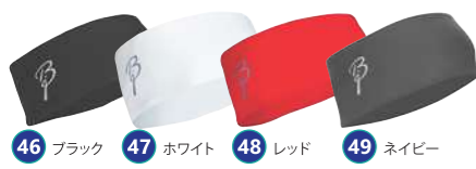
46 ブラック 47 ホワイト 48 レッド 49 ネイビー ヘッドバンドポリニット ¥3,675