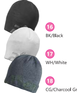
16 BK/Black 17 WH/White 18 CG/Charcoal Gray PF378HW06 ¥3,045 Hekmet Inner Watch Cap ●サイズ:フリー ●素材:ニット(ポリエステル65%、綿35%)