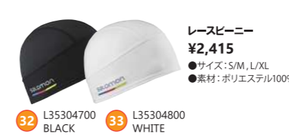
32 L35304700 BLACK 33 L35304800 WHITE レースビーニー ¥2,415 ●サイズ:S/M, L/XL ●素材:ポリエステル100%