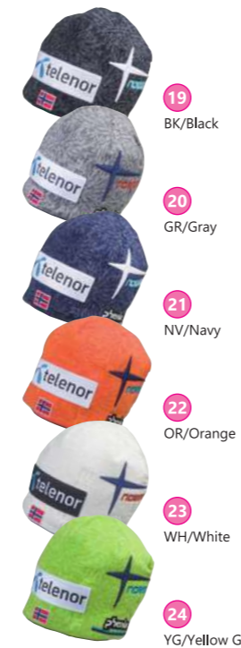
19 BK/Black 20 GR/Gray 21 NV/Navy 22 OR/Orange 23 WH/White 24 YG/Yellow Green PF378HW02 ¥5,145 Norway Team W.C. Watch Cap ●サイズ:フリー ●素材:(表)ニット(アクリル100%) / (裏)吸汗速乾フリース(ポリエステル95%、ポリウレタン5%)