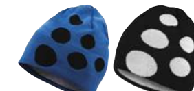
09 3336 ブルーネイビー 10 9900 ブラックホワイト 197614 BIG LOGO CAP ¥3,675 ●サイズ:SM/56,LXL/58