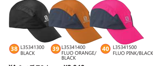
38 L35341300 BLACK 39 L35341400 FLUO ORANGE/BLACK 40 L35341500 FLUO PINK/BLACK XA キャップ フルオ ¥2,940 ●サイズ:S/M, L/XL ●素材:ポリエステル100%