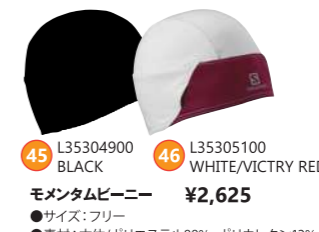
45 L35304900 BLACK 46 L35305100 WHITE/VICTRY RED モメンタムビーニー ¥2,625 ●サイズ:フリー ●素材:本体/ポリエステル88%、ポリウレタン12% 裏地/ポリエステル100%