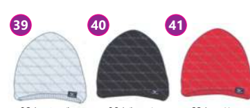
39 02/アイスブルー 40 09/ブラック 41 62/レッド A50BM-420 ニットキャップ ¥4,095