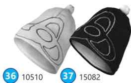
36 10510 37 15082 772170 HAT ODLO LOGO WARM ¥3,570