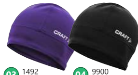
03 1492 ピンジョン 04 9900 ブラック 1902362 XC LIGHT HAT ¥3,360 ●サイズ:SM/56,LXL/58