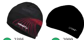
01 2395 ダークネイビー 02 2999 ブラック 194307 RACE HAT ¥4,200 ●サイズ:SM/56,LXL/58