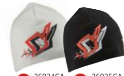
52 26024CA ホワイト 53 26025CA ブラック YBE1 BEANIE ¥1,890 ●素材:コットン100%