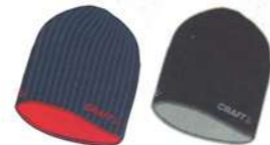
07 3395 ダークネイビー 08 2999 ブラック 194676 WS CRUISE HAT ¥5,775 ●サイズ:SM/56,LXL/58