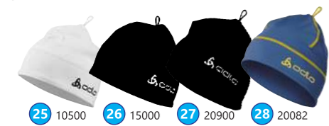
25 10500 26 15000 27 20900 28 20082 772040 HAT POLYKNIT ¥2,100