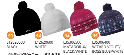
41 L12620500 BLACK 42 L12620600 WHITE 43 L35306500 MATADOR-X/BLACK/WHITE 44 L35306400 WIZARD VIOLET/BOSS BLUE/WHITE ノルディックビーニー ¥2,625 ●サイズ:フリー ●素材:本体/アクリル100%、裏地/ポリエステル100%