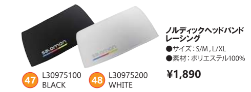
47 L30975100 BLACK 48 L30975200 WHITE ノルディックヘッドバンドレーシング ¥1,890 ●サイズ:S/M, L/XL ●素材:ポリエステル100%