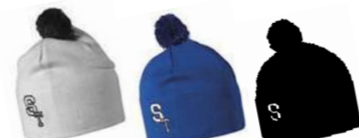
57 5055/ホワイト 58 5054/ブルー 59 5053/ブラック ST ニットキャップ ¥3,675