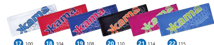
17 100 18 104 19 108 20 110 21 114 22 115 C33 ¥3,045