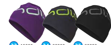
33 15000 34 20900 35 20082 791890 HAT INTENSITY ¥2,835