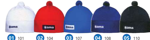
01 101 02 104 03 107 04 108 05 110 A45 RUNNING HAT ¥3,990